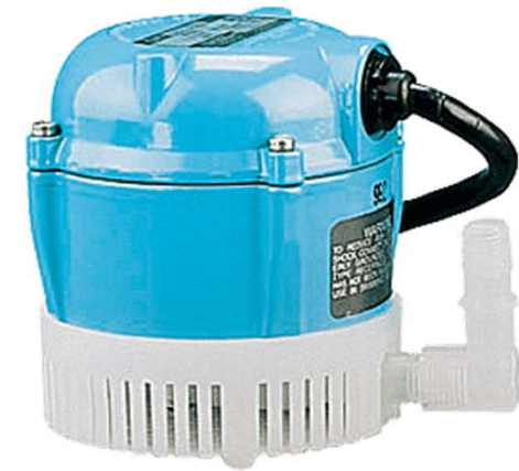
1 230V 50Hz