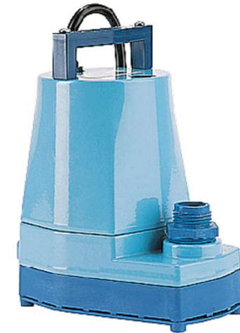
5-MSP 230V 50Hz